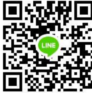
สแกนเข้ากลุ่มไลน์ “ส.ธ.จ.-รับสมัครลูกจ้างชั่วคราว”