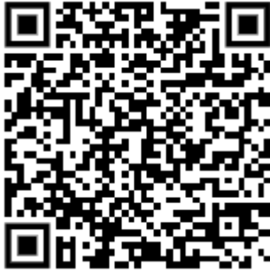
สแกนเข้าระบบรับสมัครออนไลน์

หมายเหตุ QR code สแกนเข้าระบบรับสมัครออนไลน์และกลุ่มไลน์ “ส.ธ.จ.-รับสมัครลูกจ้างชั่วคราว”